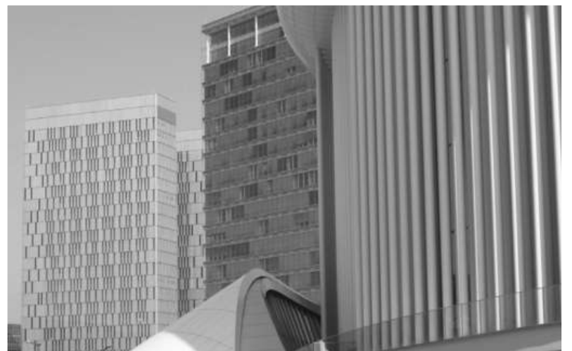
▲▲ Gëlle Fra - mälestusmärk sõdades hukkunud luksemburglastele ▲ Moderne Luxembourg

Ameeriklaste Marshalli plaan aitas riigi peale sõda kiiresti jalule. 1947. aastal sõlmiti Hollandit, Belgiat ja Luk- semburi ühendav BENELUXi tolliliit, 1949. aastal loobuti NATOsse astudes neutraalsusest. 1951. aastal oldi Euroopa Sõe- ja Teraseühenduse, praeguse Euroopa Liidu eelkäija, asutajaliige. Kuuekümnendatel muutus linn üheks Euroopa finantskeskuseks. 1981. aastal suleti viimane, riigi rikkusele aluse